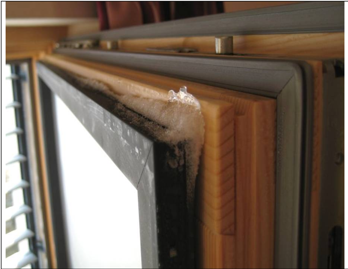
Eisbildung bei Holz-Aluminium-Fenstern ist keine Seltenheit

Damit dieses Problem entsteht, sind keine erhöhten Luftfeuchtigkeitswerte nötig. Eine Raumluft von unter 40% bei +21°C Zimmertemperatur reichen dafür völlig aus.